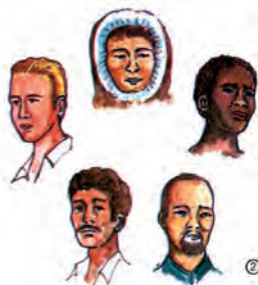
Όλοι οι άνθρωποι στη γη έχουν τις ίδιες ανάγκες... (.)

«Σήμερα ο άνθρωπος παίζει πολλούς ρόλους, επειδή συμμετείχει σε πολλές