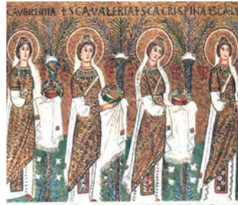
1. Γυναίκες σε θρησκευτική πομπή την εποχή του Ιουστινιανού (Ψηφιδωτή τοιχογραφία, Άγιος Απολλωνάριος, Ραβέννα)

«πολλοί χριστιανοί διώχτηκαν» (ΙΕ:21). Πρόκειται για λογότυπο εικόνας στην οποία απεικονίζονται και θηλυκές φιγούρες, «και στις θρησκευτικές γιορτές οι Βυζαντινοί χρησιμοποιούσαν διάφορα μουσικά όργανα» (ΙΕ:37). Πρόκειται για λογότυπο εικόνας στην οποία απεικονίζονται και γυναίκες. Σε εικόνα που απεικονίζονται άνδρες, γυναίκες και παιδιά, ο λογότυπος είναι: «άμαχοι Βυζαντινοί εγκαταλείπουν τη φλεγόμενη πόλη τους» (ΙΕΤΕ:25)