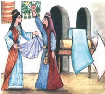
3. Οι γυναίκες στο Βυζάντιο διακρίνονταν στο εμπόριο των υφανμάτων.

«Ποιες εικόνες χρησιμοποιούν οι ποιητές στα παραπάνω τραγούδια» (ΕΓ2: 18) (σημ. οι δύο δημιουργοί είναι γυναίκες η Αρλέτα και η Μ. Κριεζή)