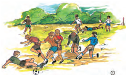
Αυτά τα παιδιά ήθελαν να παίξουν ποδόσφαιρο αλλά δεν τα κατάφεραν. Γιατί... (.)

ομάδες. Ο δάσκαλος π.χ. μπορεί να παίζει το ρόλο του διευθυντή του σχολείου, του δασκάλου μέσα στην τάξη, του πατέρα, του προέδρου σ ένα σύλλογο (πολιτιστικό, αθλητικό, συνδικαλιστικό) (ίσως και του ιεροψάλτη) (ΚΠΑΕ: 38).